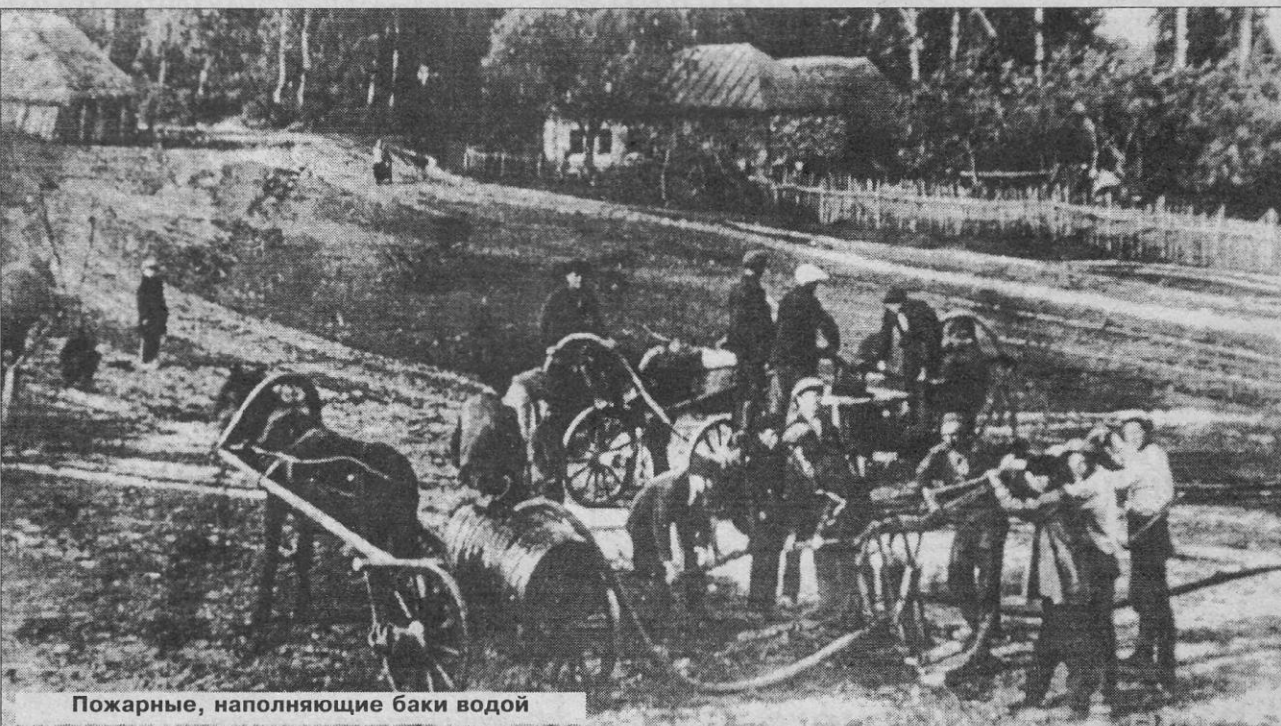
Пожарные, наполняющие баки водой

Т. БУДНИКОВА. (В публикации использованы документы ЦГАМО.)